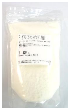
コラーゲン・トリペプチド 200g

アミノ酸3つで構成された最小単位のコラーゲン 普通の「コラーゲン」はアミノ酸が 1,000個 の大きな塊なので、 そのままの形では吸収されません。いちど分解・消化される為、 コラーゲンとして吸収されるのは一部だけ。 しかし！「コラーゲン・トリペプチド」はアミノ酸が 3個 の小さな塊なので、 そのままの形で吸収される優れもの！ しかも、体への吸収スピードも速いのです！ ★マメ知識★ トリペプチドの【トリ】はギリシャ語で 3 を意味します